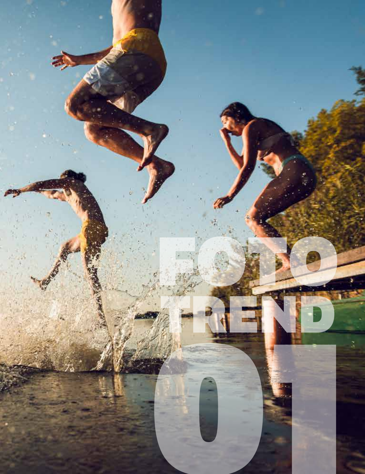
FOTO TREND 01

LEBENSFREUDE, FREIHEIT, NATURALISMUS, SPASS, ECHT